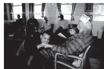
Die erste Kursgruppe beim Rollenspiel "Der Schattenkönig"

Die Liste der Themen für diese Struktur umfasst unter anderem: Gesellschaftliche Erwartungen; Vater-Einfluss; Mutter-Einfluss, Umgang mit Autorität; Beziehung zu Männern; Beziehung zu Frauen; Sexualität; Trauer / Verlusterfahrungen; Glaubensweg.