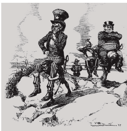
„Die Bürde des Weißen(?) Mannes“ Veröffentlicht in "Life" am 16. März 1899 (USA).

So findet vereinbarte partnerschaftliche Kooperation in der Planung und Durchführung von Freiwilligenprogrammen z.B. nicht statt, wenn das Wissen um die Finanzierungsmechanismen des Programms von der Entsendeorganisation nicht mit